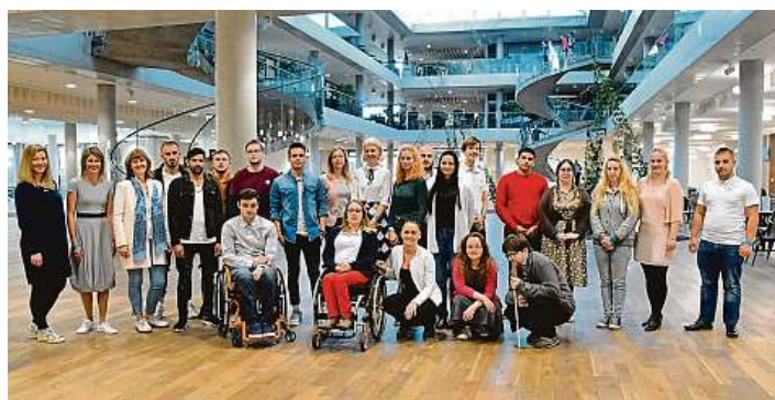
Fond vzdělání zajistil od roku 1995 stipendia pro téměř 700 nadaných, ale zdravotně či sociálně znevýhodněných studentů

Tipy a snímky do rubriky zasílejte na pozitivnizpravy@lidovky.cz